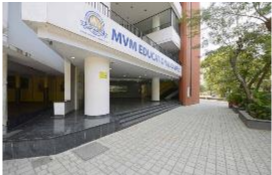
ಮುಂಬೈ ಮೊಗವೀರ ವ್ಯವಸ್ಥಾಪಕ ಮಂಡಳಿಯ ಸುಸಜ್ಜಿತ ಕಟ್ಟಡ

ಸದ್ಯ ಜನೋಪಯೋಗಿ ಕಾರ್ಯದಲ್ಲಿ ನಿರತವಾಗಿರುವ ಅಂಗಸಂಸ್ಥೆಗಳು - ಎಂವಿಎಂ ಇಂಟರ್ ನೇಷನಲ್ ಸ್ಕೂಲ್, ಅಡ್ವಾಂಟೇಜ್ ಎನ್ ದಿನಕರ್ ರಾವ್ ಮತ್ತು ಶ್ರೀಮತಿ ಧನವಂತಿ ರಾವ್ ನರ್ಸರಿ, ಬೋಳೂರು ಶ್ರೀಮತಿ ಮನೋರಮಾ ಜಿ ಸುವರ್ಣ ಪೂರ್ವ ಪ್ರಾಥಮಿಕ ಶಾಲೆ, ಬೆಂಗಳೂರು ಗಂಗಾಧರ ಪಿ. ಸುವರ್ಣ ಪ್ರಾಥಮಿಕ ಶಾಲೆ ಸ್ವಾಮಿ ಮುಕ್ತಾನಂದ ಪ್ರೌಢಶಾಲೆ, ಸಸಿಹಿತ್ತು ಭವಾನಿ ಮೆಂಡನ್ ಮತ್ತು ಮೋಹನ್ ಮೆಂಡನ್ ವಾಣಿಜ್ಯ ಕಿರಿಯ ಮಹಾವಿದ್ಯಾಲಯ, ಜರ್ಕಲಾ ಸುಧಾಕರ ಹೆಗ್ಡೆ ಕಾಲೇಜ್ ಆಫ್ ಮೇನೇಜ್ ಮೆಂಟ್ ಸ್ಟಡೀಸ್, ಮೊಗವೀರ ಬ್ಯಾಂಕ್ ಕಾಲೇಜ್ ಆಫ್ ಸೈನ್ಸ್, ಎಂವಿಎಂ ಕಾಲೇಜು, ಅಕೌಂಟಿಂಗ್ ಆಂಡ್ ಮ್ಯಾನೇಜ್ ಮೆಂಟ್ ಮಹಾವಿದ್ಯಾಲಯ